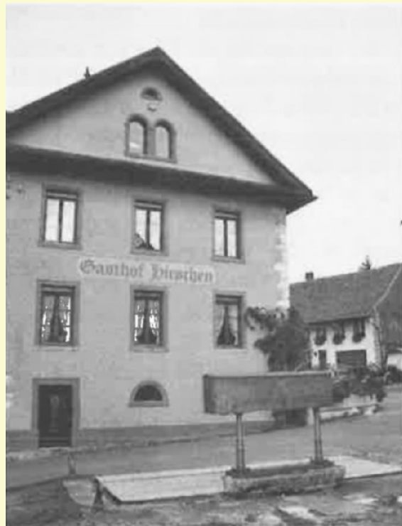
Die Brückenwaage beim Rest. Hirschen