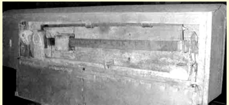
Brückenwaage im „Ruhestand“

Den Einnahmen aus dem Betrieb der Brückenwaage standen natürlich auch Unkosten gegenüber. So musste die Waage jedes Jahr neu geeicht werden. Dies lohnte sich aber, war die Waage doch auf 100g genau, ausser bei starkem Wind. Dann konnte die Anzeige schon ab und zu schwanken. Auch sonst entstanden aus dem Unterhalt Kosten, welche zum Schluss die Mieteinnahmen fast ausglich.