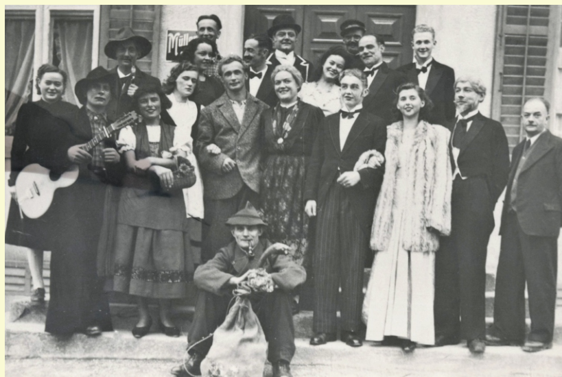
Männerchor um 1950 „Der Spieler von Monte Carlo“

Etwa 250 Personen fanden im Saal Platz, sofern man den Anbau im hinteren Teil auch benutzte. Wer aber nur noch im Anbau Platz fand, musste das Geschehen auf der Bühne stehend an den Seitenwänden des Saales verfolgen! In den 60er-Jahren wurde ein Notausgang vorgeschrieben. Da in allen Vereinen auch Feuerwehrmänner vertreten waren, konnte diese Auflage problemlos gemeistert werden: Während der Dauer des Anlasses stellte die Feuerwehr auf der Rückseite des Saales beim „Meili-Haus“ eine Leiter an ein Fenster wie einfach!