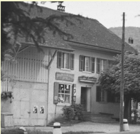
Handlung v. K. Frei : s 'Karlis Laden

Der Konsumverein, die Gnossi in Ober- und Unterehrendingen, s'Willi-Lädeli, s'Karlis, die Bäckerei Moser, die Hirschen-Bäckerei, die Metzgerei Bolliger alle diese Läden boten Einkaufsmöglichkeiten nicht nur für den Alltag, nein auch viele Kundenwünsche die über den täglichen Bedarf hinausgingen konnten erfüllt werden. Beim Erinnern haben mir in vielen Gesprächen ehemalige Ladenbesitzer, Filialeiterinnen, Verkäuferinnen und Ehrendinger Einwohner geholfen.