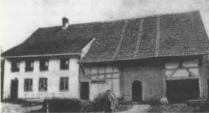
Kosumdepot im Binderhaus