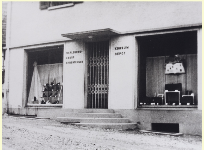
Kosum um 1945