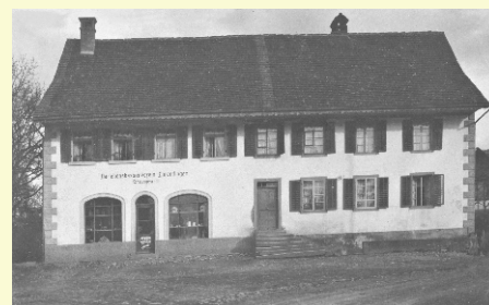
Gnossi um 1920